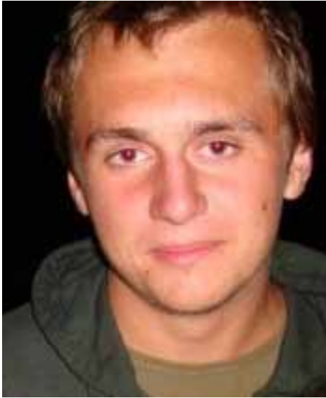
Jason Segel, acteur