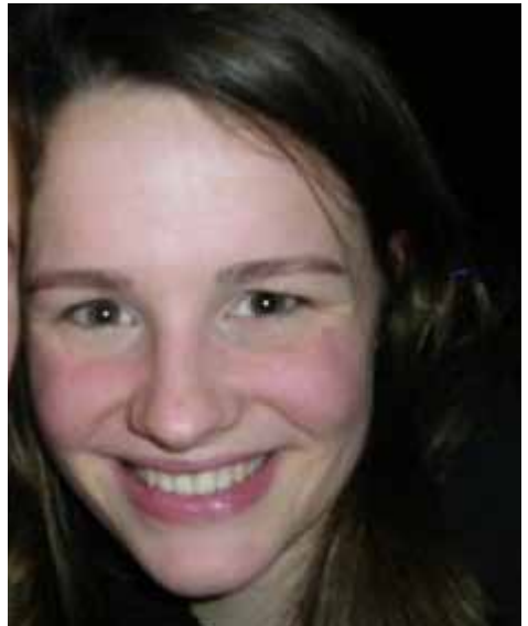
Julia Roberts